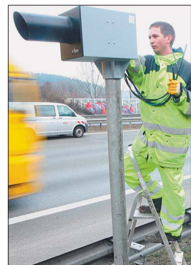
15 000 Knöllchen pro Jahr wurden erwartet, 40 000 Eilige wurden in den ersten drei Wochen geblitzt.

Die Blitzanlage am Bielefelder Berg, die alle drei Fahrspuren abdeckt, wurde am 12. Dezember in Betrieb genommen. Seitdem sind bereits gut 40 000 Autofahrer in die Radarfaller gerast; ihnen werden demnächst teure Fotografien ins Haus flattern – sofern die Verwaltung es eben schafft, ihren Vorgang binnen dreier Monate zu bearbeiten. Danach ist die Geschwindigkeitsübertretung verjährt.