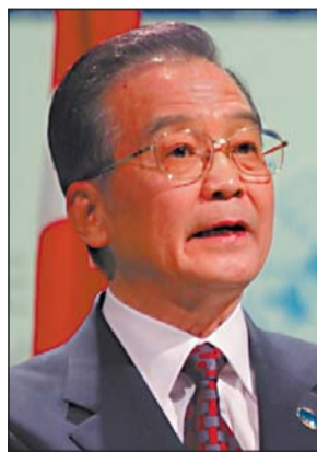
Wen Jiabao einigte sich mit Barack Obama.