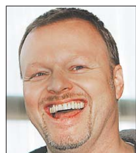
Stefan Raab kooperiert vielleicht mit der ARD.

Hamburg (dpa). Soll der TV-Moderator Stefan Raab zum Retter der deutschen Grand-Prix-Ehre werden? Möglicherweise holt ihn die ARD ins Boot. Raab, Ausrichter des »Bundesvision Song Contest«, war 2000 mit »Wadde hadde dudde da« Fünfter im Eurovisionfinale. Eine Kooperation mit Raabs Haus-sender Pro7 soll im Ge-