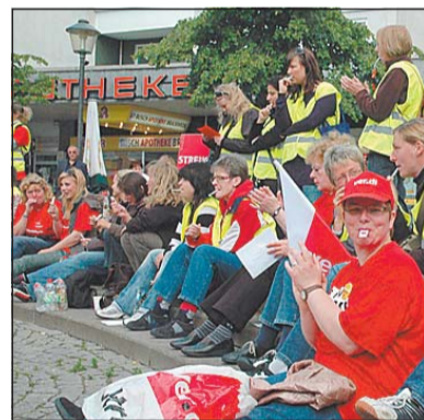
Protestkundgebung in Bielefeld-Brackwede.

Durch den Aufruf sieht das Arbeitsgericht Kiel das »Ultima-Ratio-Prinzip« verletzt. Danach müssten zuerst alle anderen Wege in Verhandlungen ausgeschöpft werden, bevor gestreikt werden darf. Zudem sei der von Verdi vorgelegte Tarifvertragsentwurf zum Gesundheitsschutz rechtswidrig, hieß es. Außer um den geforderten Gesundheitstarifvertrag geht es bei den Tarifverhandlungen um das Gehalt der Erzieherinnen. Bundesweit arbeiten etwa 220 000 Erzieher und Sozialarbeiter in kommunalen Einrichtungen. Sie verdienen nach Angaben der Gewerkschaft Verdi zwischen 2300 und 2700 Euro brutto im Monat. Etwa 60 Prozent von ihnen arbeiten allerdings nur in Teilzeit. Sie bekommen monatlich etwa 1500 Euro brutto. Lokalteil Seite 4: Leitartikel