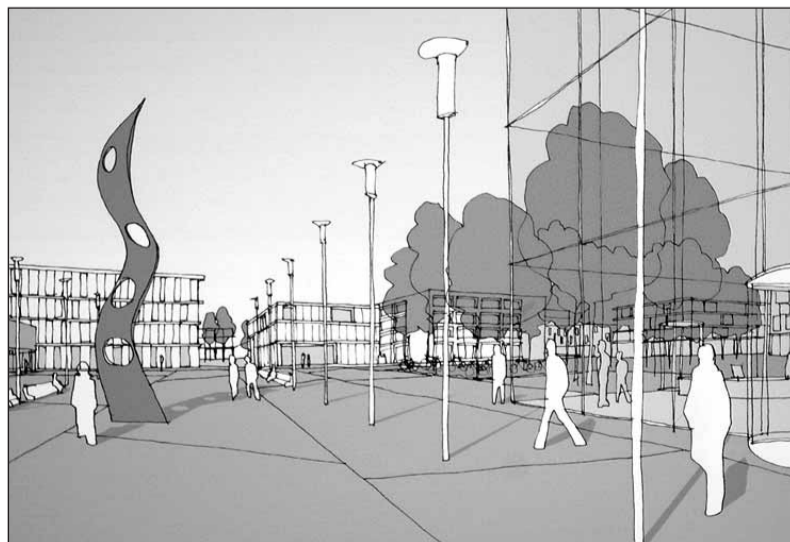
Die Plaza soll der zentrale (Treff-)Punkt des Hochschulcampus sein. Erstes Modul soll der Neubau der Fachhochschule werden.

Die »Perlenkette« verknüpft Plätze, Terrassen, Sportfelder und Erholungsräume miteinander. Auf der Nordseite der heutigen Universität sollen Sport- und Freizeitangebote entstehen, ein Schwimmbad am Ende des alten Campus gilt als zentrale Attraktion. Zwischen neuem und altem Campus soll als »funktionales Verbindungselement« die Mensa mit Platz für 1000