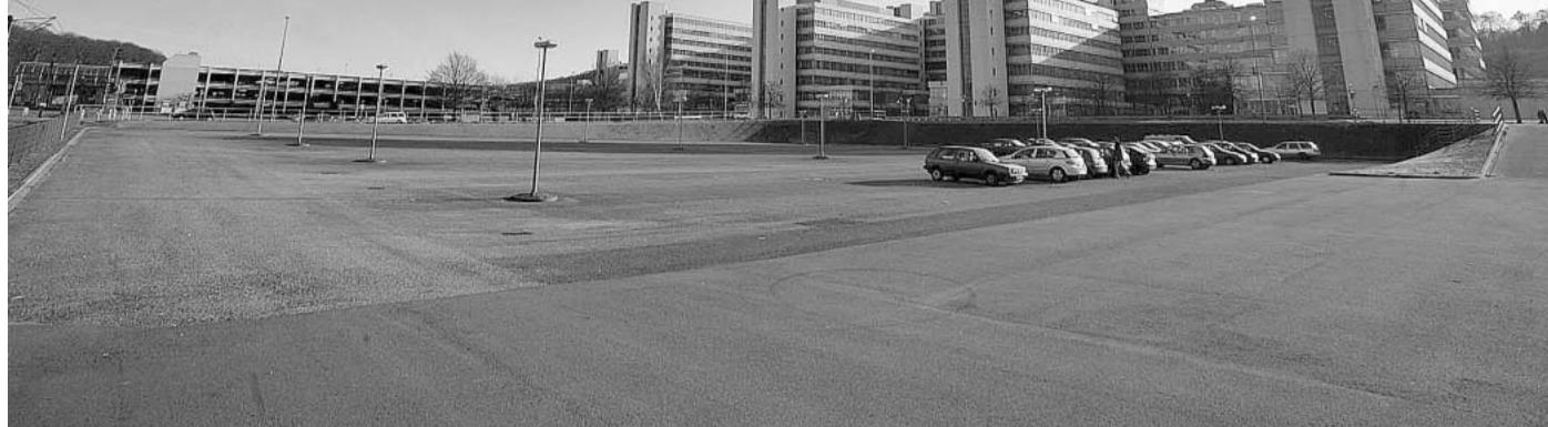
„Der größte ungenutzte Parkplatz Bielefelds“: Helmut Hruby und Frank Frick, von links, fragen sich, warum nicht wenig bis gar nicht genutzte Flächen direkt an der Uni für die Neubau-Visionen genutzt werden – wie der große Uni-Parkplatz (vorne).