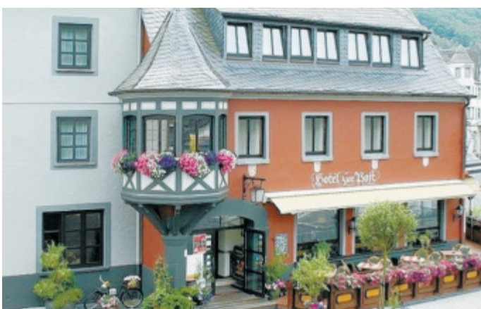
Ein Wochenende im Weihnachtsdorf: Wer an der Abstimmung teilnimmt, hat die Chance, eine zweitägige Reise nach Waldbreitbach im Westerdal zu gewinnen. Übernachtet wird im Hotel zur Post.

Zudem hält Bill die Teilung der Planverfahren sowie das Zurückstellen der Fragen zur Stadtbahnlinie-4-Verlängerung für unzulässig. Wegen der „handwerklichen Fehler“ im Verfahren geht Bill davon aus, dass das Gericht den Bebauungsplan für unwirksam erklären wird.