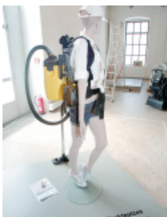
Nacktputzen: Auch die sexuelle Männerphantasie von der willigen Dienerin ist Thema in der Ausstellung. Es gibt sogar Agenturen dafür.