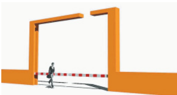
Schranke mit Torbogen: Eine aufwändigere Gestaltung soll den Überweg über die Stadtbahnstrecke ansehnlicher machen. ENTWÜRFE: DÖLL/GTB

bindenden Beschluss verhinderte aber der Umwelt- und Stadtentwicklungsausschuss, in dem er das Thema vertagte. Alle Optionen sollten offen bleiben. Als Alternativen stellte die Verwaltung damals eine 215 Meter lange und 4,50 Meter hohe Brücke mit Treppen und Aufzug sowie eine Verschiebung der Haltestelle Wellensiek Richtung Uni, bei der die Stadtbahn am Überweg schon langsamer gefahren wäre, in den Raum. Nach intensiven Prüfungen und Beratungen ruderte die Lenkungs-