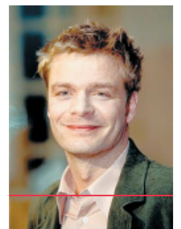
Überraschung garantiert: Neue TV-Show mit Oliver Geissen.

Anmeldung: Reisebüro Reiselust Herford, Telefon (05 22 1) 99 40 33. Mindestalter 18 Jahre. NW-Kartenbesitzer erhalten auf den Preis von 59 Euro einen Bonus von 4 Prozent als Rückvergütung.