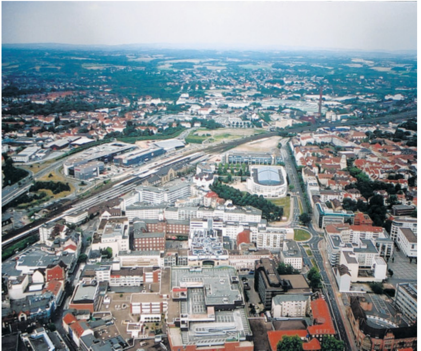
Spitzenreiter: Die Stadt Bielefeld – hier ein Blick aufs nördliche Zentrum mit Stadthalle, Hauptbahnhof und links dem Neuen Bahnhofsviertel – hat in OWL die meisten Wohn- und Verkehrsflächen (41 Prozent der Bodenfläche). Dort leben aber auch mehr Einwohner als in jeder anderen Stadt der Region. Am oberen Bildrand sind noch unbebaute Wiesen und Wälder zu sehen.