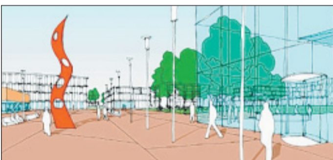
Blick auf den Campus: So könnte die neue Hochschullandschaft auf der Lange Lage aussehen. ENTWURF: DÖLL

Projekte vom Uni-Stammgebäude, über eine neu zu bauende Mensa auf den Parkplätzen zum neuen Campus, in dem die neue Fachhochschule auf der Südseite „als Flaggship“ liegt. Die anderen Module wie Institute, Forschungs- und Entwick-