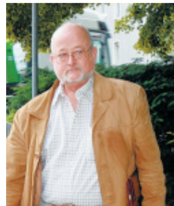
... mit Hermann E. Geller, der die Besetzer vertritt.